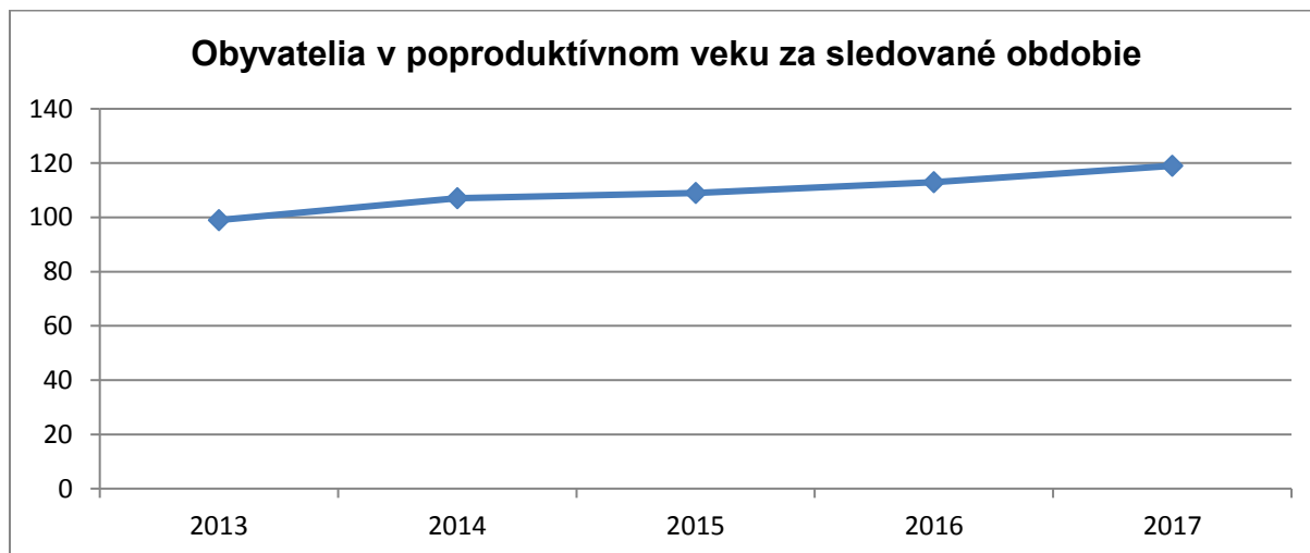
Graf č. 2

Graf č. 2 znázorňuje graf, kde je zrejme kontinuálny nárast občanov v poproduktívnom veku, aj keď tento nárast je rádovo v jednotkách občanov, ktorí sa z produktívneho veku presúvajú do kategórie občanov poproduktívneho veku. Krivka grafu ukazuje okrem stúpajúcej tendencie nárastu starších občanov aj skutočnosť, že postupne bude v obci Dolné Plachtince stúpať potreba a požiadavky občanov na poskytovanie alebo zabezpečovanie sociálnych služieb občanom seniorom.